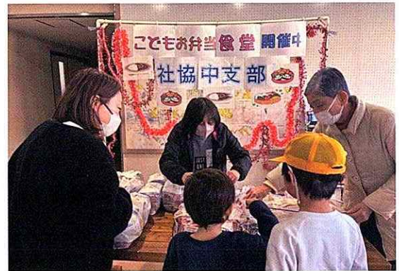
▲中支部ごどもお弁当食堂（支部社協への助成・活動支援）