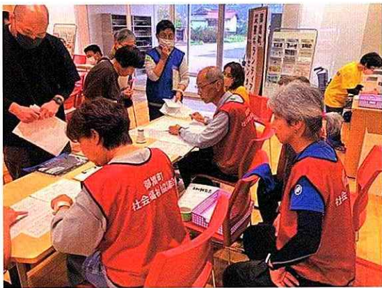
▲災害ボランティアセンター立ち上げ訓練 （災害ボランティアセンター事業の実施）