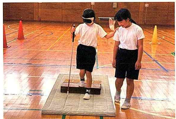
▲御高小学校福祉体験教室 （福祉協力校への活動支援）