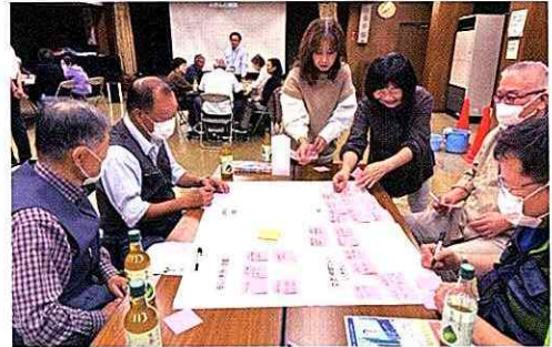
▲お互いさまで支え合う地域づくりの開催 （第2層生活支援協議体）