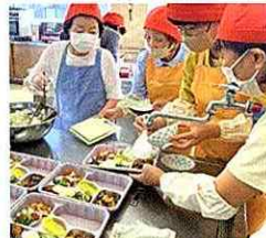
食事サービス事業