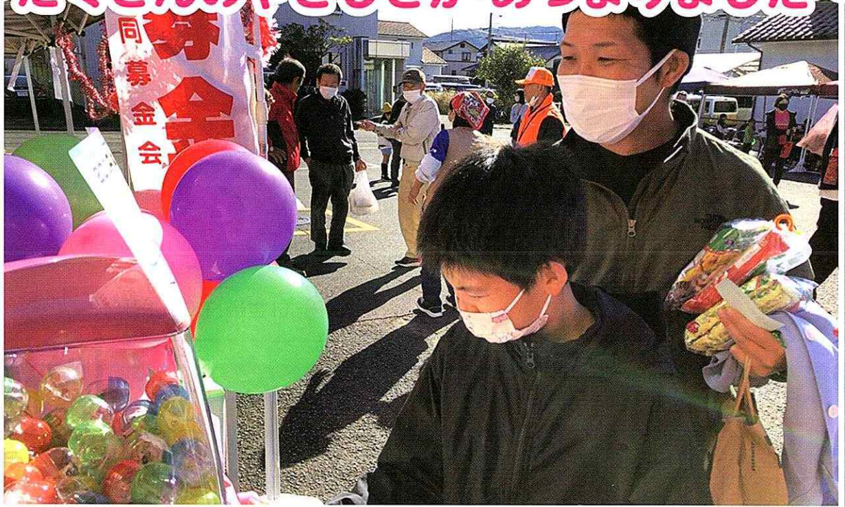
▲11月24日(日)上之郷公民館まつり 街頭募金