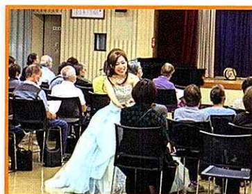
▲参加者の皆さんと一緒に懐メロを歌いました