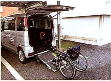
スペースシア (スロープ付き軽自動車) 車椅子1台固定・・・3人乗り