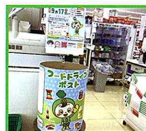
▲V・ドラッグ御嵩店