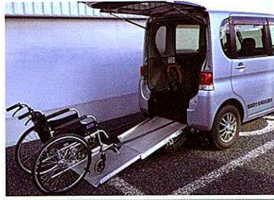
タント (スロープ付き軽自動車) 車椅子1台固定・・・3人乗り