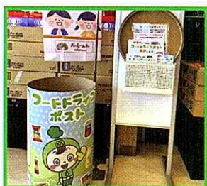
▲スーパーマーケットバロー御嵩店