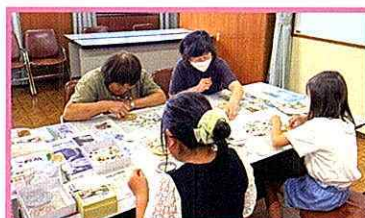
▲モザイクタイルのコースター作り