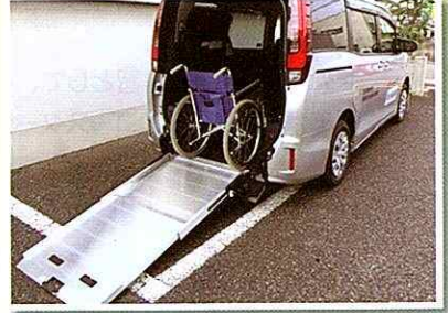
ノア (スロープ式ワンボックスカー) 車椅子1台固定・・・7人乗り 車椅子2台固定・・・5人乗り

社会福祉協議会では、車椅子を利用されている方の外出支援の一環として、車椅子のまま乗ることができる福祉車両の貸出事業を実施しています。通院や買い物、旅行などの外出時にご利用ください。