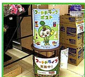
▲V・ドラッグ御嵩東店