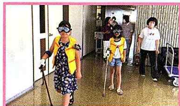
▲認知症サポーター養成講座での高齢者疑似体験

また、お楽しみ学習として、在宅介護支援センターのケアマネジャーによる「認知症サポーター養成講座」や「モザイクタイルのコースター作り」などを行いました。