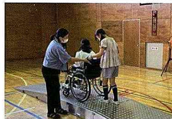
▲ 福祉協力校への活動支援