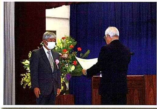
▲福祉活動にご尽力された皆様に表彰を行いました。