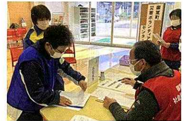
▲ 災害ボランティアセンター事業