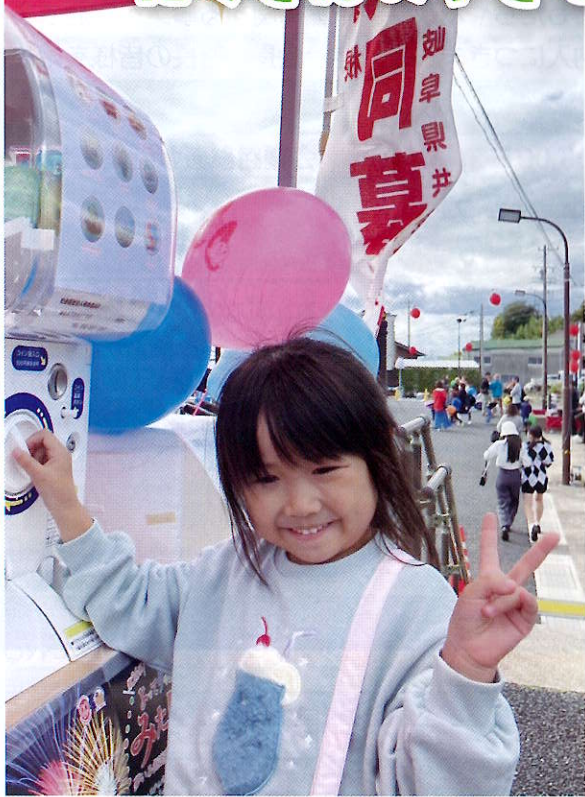
▲10月21日(土) よってりやあみたけ 街頭募金