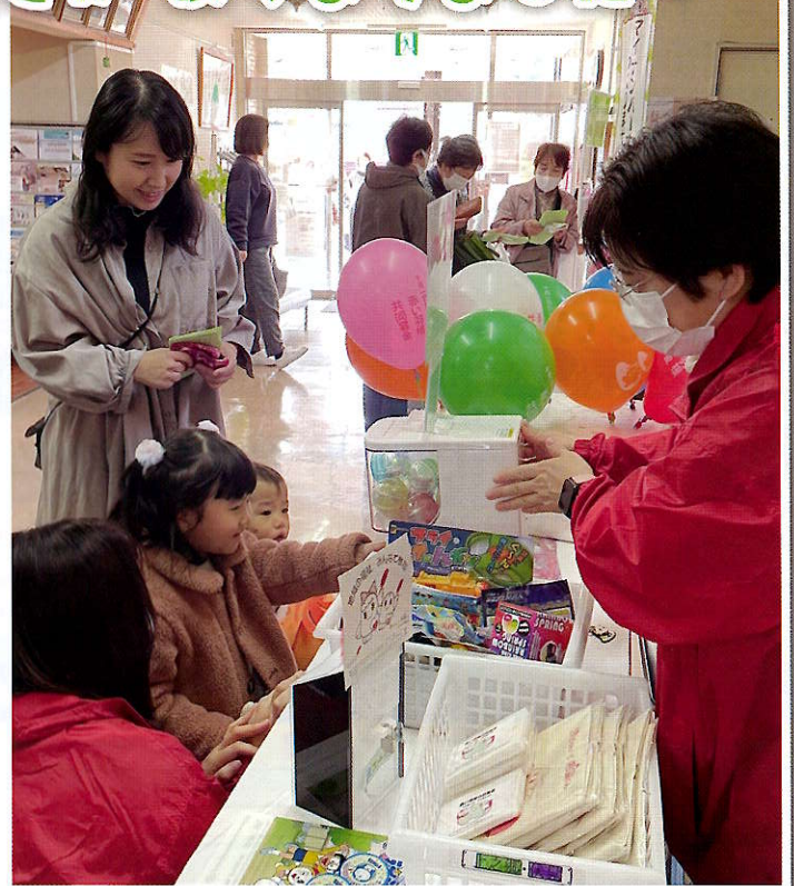
▲11月26日(日) 上之郷公民館まつり 街頭募金