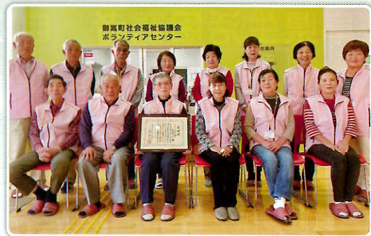
▲ちよこっと支え合い活動サポーターの皆さん