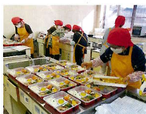
食事サービス事業