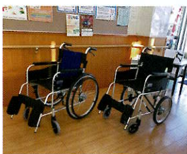
車椅子、電動ベッドの貸出