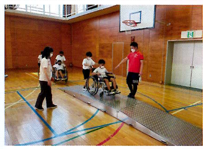
町内の小学校への福祉学習指導