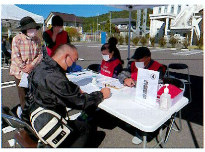
災害ボランティアセンター 設置・運営訓練