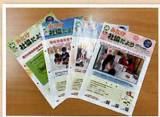
社協だよりの発行