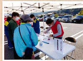
災害ボランティアセンター 設置・運営訓練