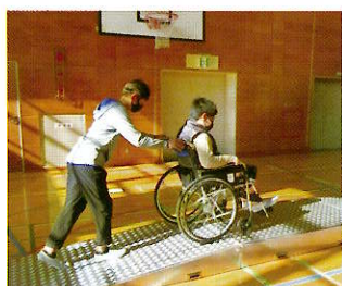
町内の小学校への福祉学習指導