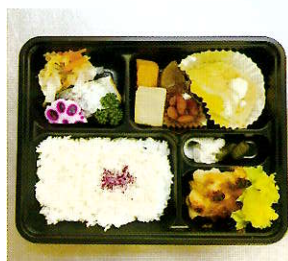
食事サービス事業