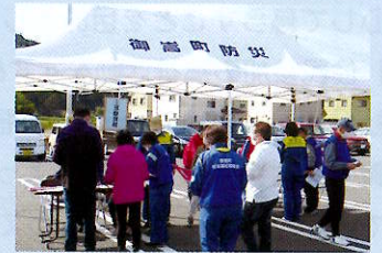
災害ボランティアセンター設置・運営訓練