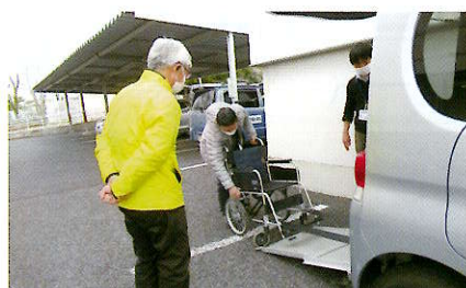
地域デビュー講座の開催 ～送迎ボランティア編～