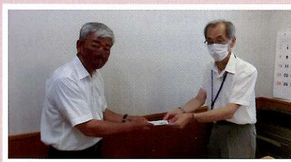
御高町安全協議会 様

匿名 様…………… 尿取りパッド、リハビリパンツ 匿名 様…………… 紙オムツ、タオル