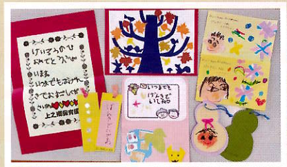
▲町内各園の園児さんからの祝いカード