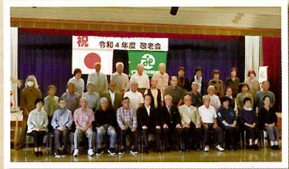
▲参加者の皆さんで記念撮影

9月28日(水)に中公民館において、満75歳になられた方(昭和21年4月2日～昭和22年4月1生まれ)のみを対象に4地区合同で、3年ぶりとなる敬老会を開催しました。今年度は、新型コロナウイルス感染防止対策のため、式典とアトラクションのみでの開催となりましたが、久しぶりに会った友人や知人との話がはずみ、懐かしいひとときを楽しまれました。