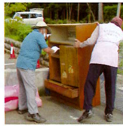
ちょこっと支え合い サポーター活動