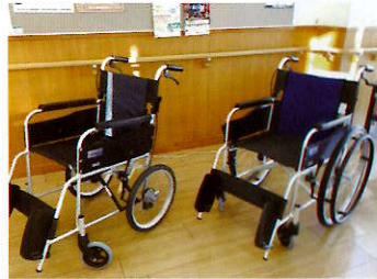
車椅子、電動ベッドの貸出