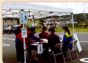
災害ボランティアセンター 設置・運営訓練