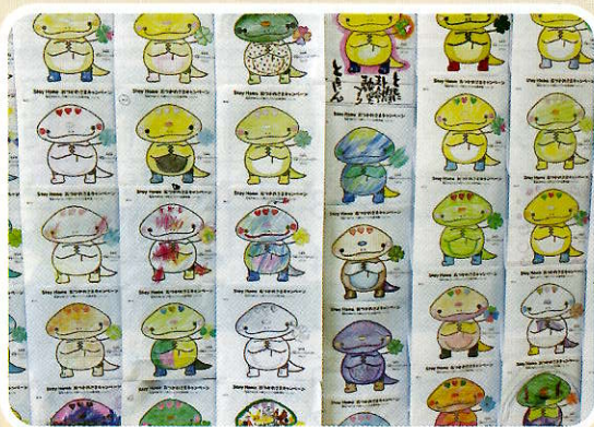
StayHomeおつかれさまキャンペーン （福祉のぬりえ、川柳募集）