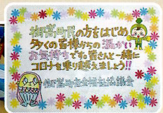
町内の皆様から寄付いただいたマスク等にボランティアさん 手書きのメッセージを添えてお届けしました