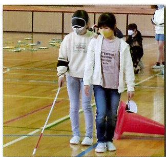
町内の小学校への福祉学習指導