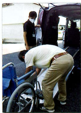
地域デビュー講座の開催 ～送迎ボランティア編～