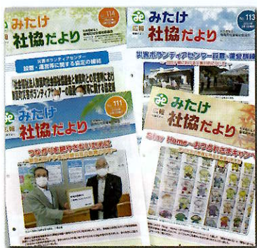
社協だよりの発行