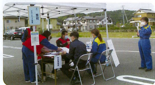
▲災害ボランティアセンター事業