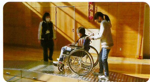
▲福祉協力校への活動支援