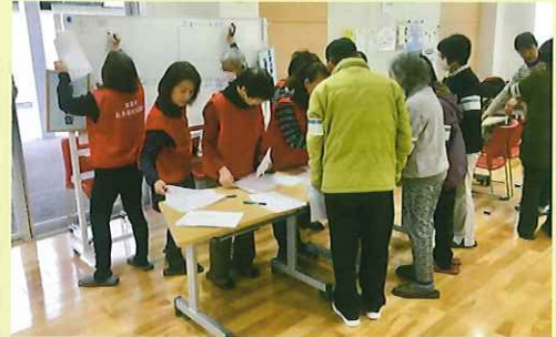
災害ボランティアセンター 立ち上げ訓練