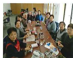
ふれあいサロン 朝顔の会（大庭台）

見学させていただいて、感じたことは、皆さんが笑顔で生き生きと活動されていることです。それが、元気の源になっているんだなと思います。これからたくさんの活動を体感し、情報を発信していきます。