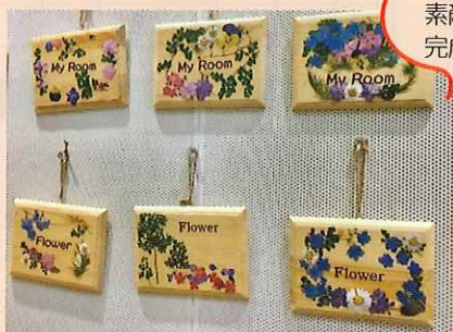
押し花を使って、 素敵な作品が 完成しました

当日は参加者の皆さん全員が、終始穏やかな笑顔で過ごされ、会話も途切れることなくはずんでいました。最後のマッチングでは、3組のカップルが成立しました。今回も多くのお問い合わせやご応募をいただき、ありがとうございます。今後も出会いの場の提供を計画していますので、ご期待ください。