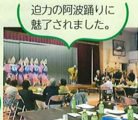
迫力の阿波踊りに 魅了されました。