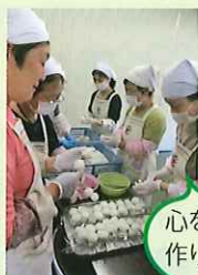
心を込めて 作りました。

終始なごやかな雰囲気の中、日赤奉仕団の皆さんが七輪で焼いた出来たてのごへだや田楽を味わいました。地元の方による踊りや演芸などを鑑賞しながら、楽しい1日を過ごされました。