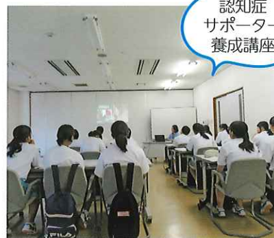
認知症 サポーター 養成講座