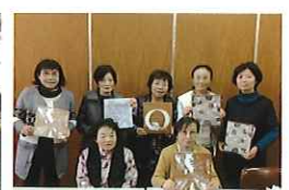
伊勢型紙同好会 （中公民館）