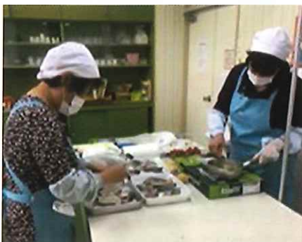
食事サービス事業の実施