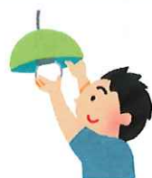
電球交換や簡単な修理