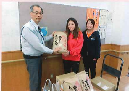
カーブスラスパ御嵩店様

匿名様 ..... 2,003円 匿名様 ..... 12,000円 匿名様 ..... 12,000円