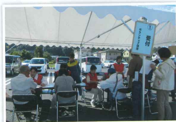
災害ボランティアセンター事業