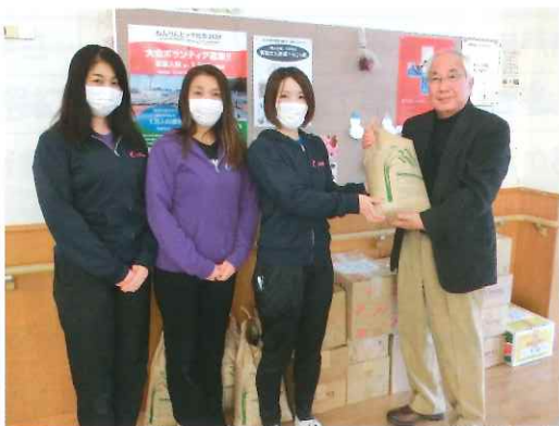
カーブスラスパ御嵩店 様

この度、女性専用フィットネスクラブのカーブスラスパ御嵩店様より、この事業の一環として、会員の皆様に呼び掛けて集まった食料等（米、缶詰、乾物、レトルト食品など）をご寄付いただきました。ありがとうございました。頂いた食料品は、「ふしみこども食堂」の皆様にお届けしました。