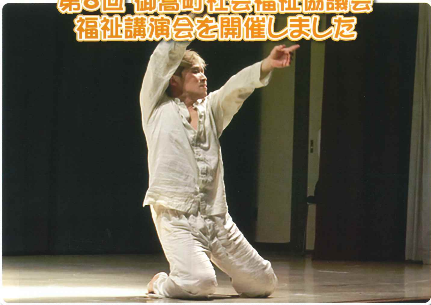
義足のプロダンサー大前光市氏による講演の様子